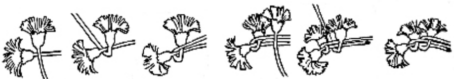
Artikelförfattaren tycker att det är ”närmast obegripligt” hur kransar binds utan hjälpmedel. Här en liten guide.

MIDSOMMARDYGNET ÄR vid sidan om vintersolståndet årets märkligaste solvarv. Det är en tid fylld av liv och rörelse. Det är en tid då inte bara Heimdall utan också hans ättlingar