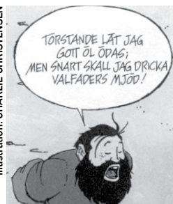
Illustration: CHARLIE CHRISTENSEN