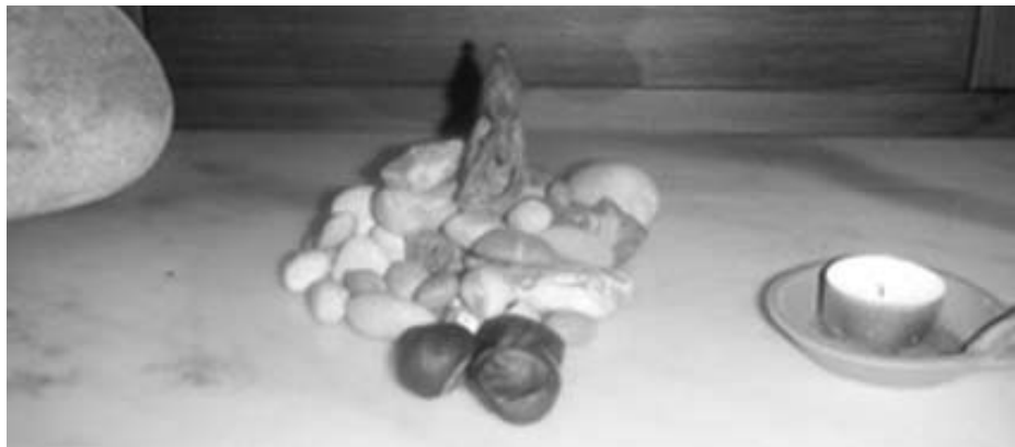
Tre kastanjer blotade vid Torshargen.