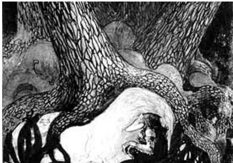
Teckning: JOHN BAUER, 1909

Varna de små innan du fäller träd eller häller ut varmt vatten. En nog så viktig del av en ekologisk andlighet.