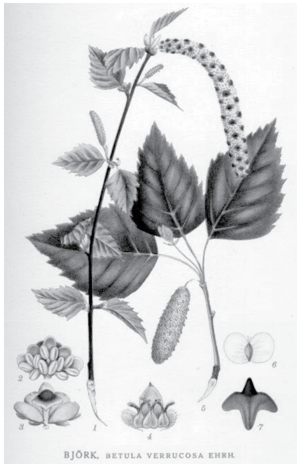
BJÖRK, BETULA VERRUCOSA EHRH.