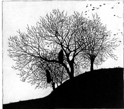
Teckning: CHARLIE CHRISTENSEN

“Nu hade rakade män börjat komma till Skåne för att predika den kristna läran. De hade mycket att tala om och kvinnor funno det nöjsamt att doppas av främlingar och få en vit särk till skänks. Men snart hade främlingarna ont om särkar, och därför gick det smått med kristnandet . . . ”