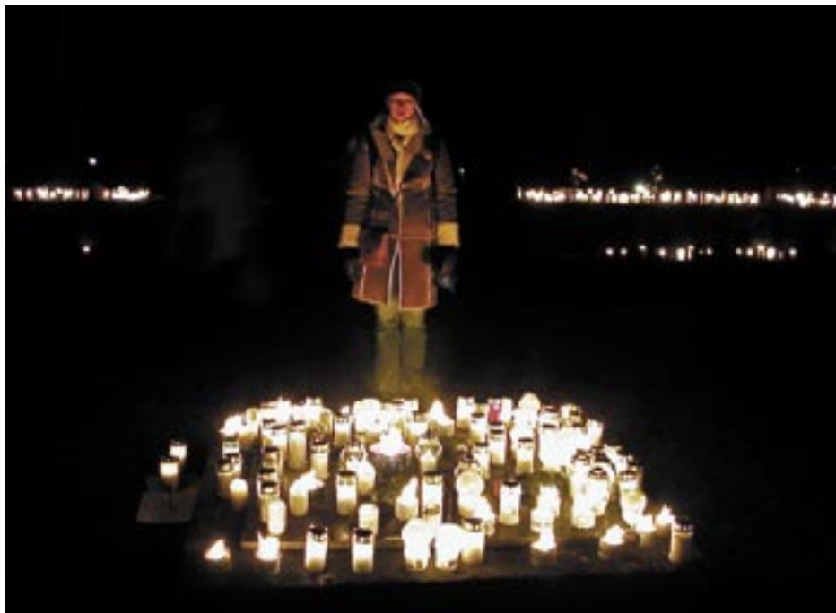
Lyktor på Skogskyrkogården, Allhelgona 2002.