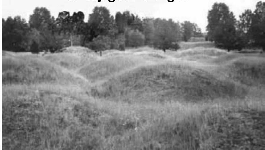
Gravfält utanför Ljungby i Småland.