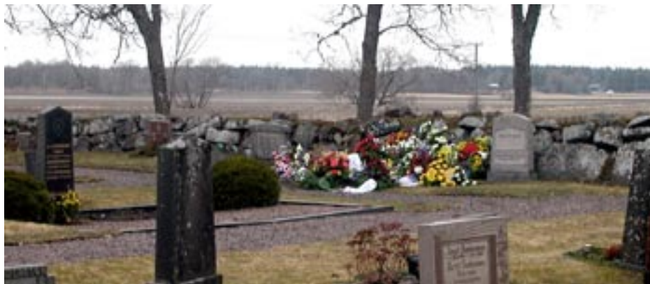
Ny grav påsken 2005.