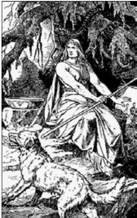
Hel med några attribut och helveteshunden Garm som ska tjuta vid Ragnarök. Okänd konstnär.

Den vikingatida överklassen ville gärna se sig som bättre än vanligt folk och myten om Valhall dit de som fallit i strid kommer, till skillnad från dem som dör av ålder eller sjukdom som kommer till Hel, är väl ett uttryck för detta. Dock ska vi komma ihåg att när Balder dräps kommer han till Hel.